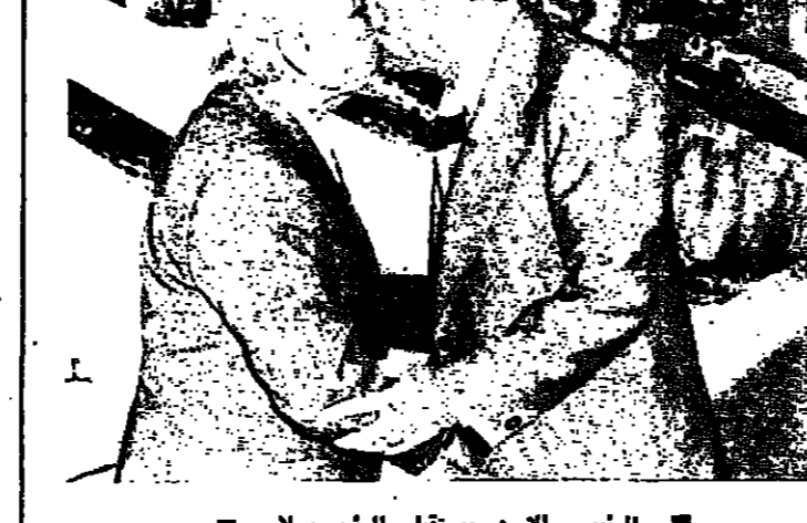
الرئيس الاسد يستقبل الرئيس سلام

عاد الى القاهرة ظهر امس ، قادما من بغداد المهندس احمد عز الدين هلال وزير البترول ، بعد زيارة رسمية للعراق استغرقت ثلاثة ايام . القاهرة - اشرا